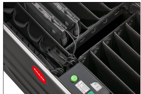
- Ladeinheit (Switch On/Off)