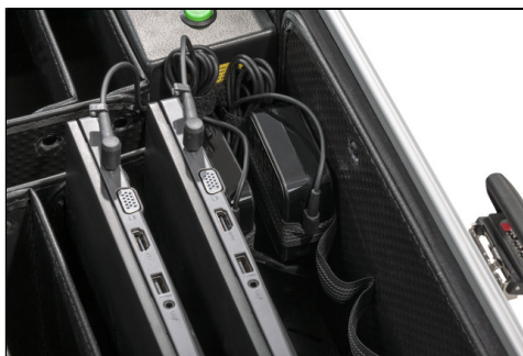
- 10x Staufächer für Laptops